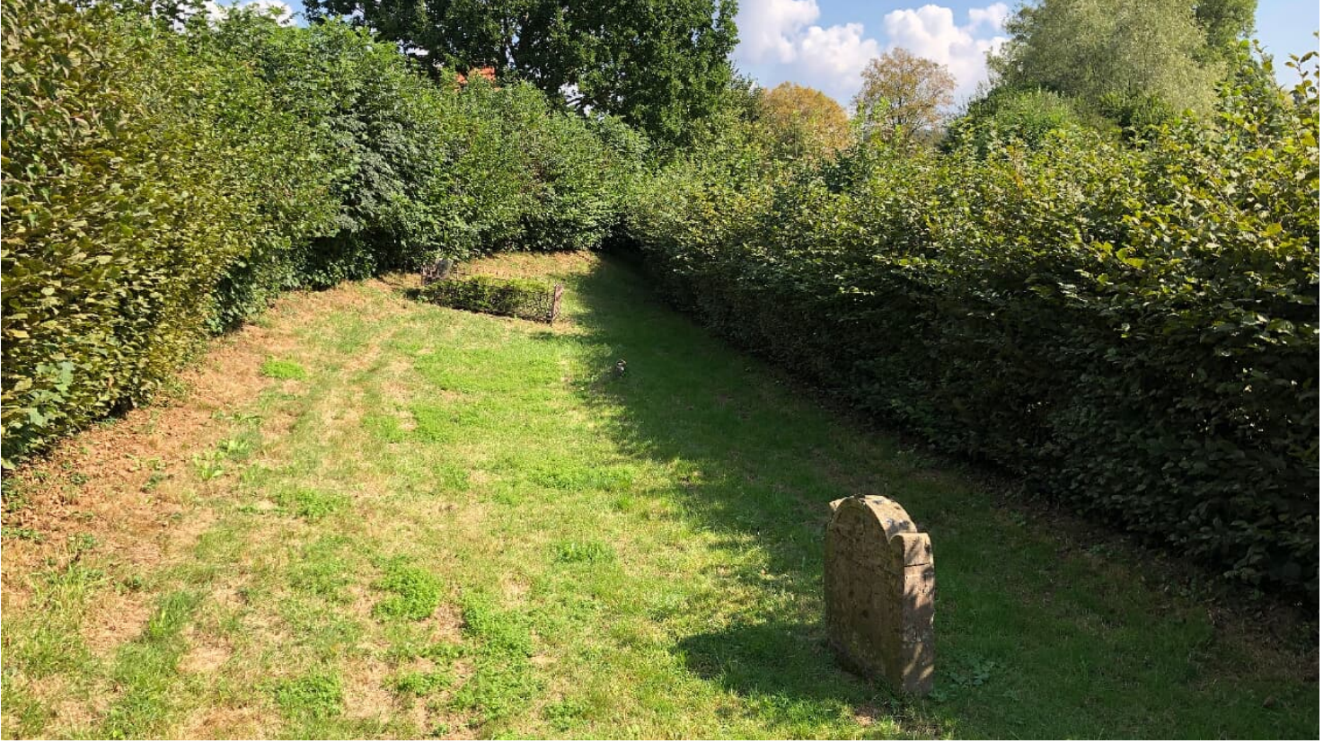
Jüdischer Friedhof Bega CC BY-SA - LTM.JPG