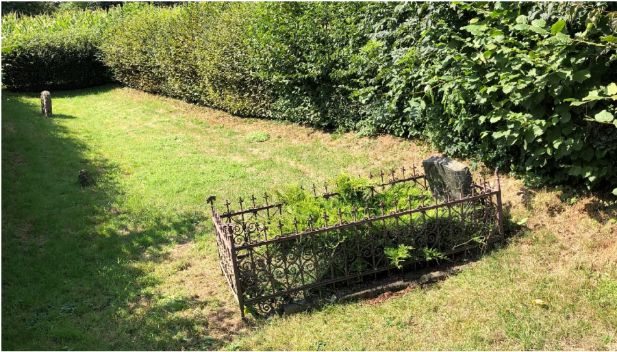
Jüdischer Friedhof Bega 2 CC BY-SA - LTM.JPG