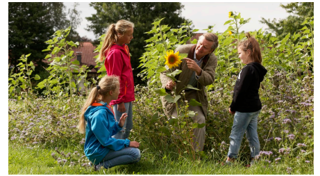
Kinder an Blühstreifen CC BY-SA - LTM.jpg