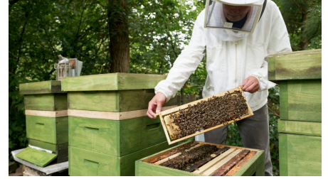
Imker an Waben