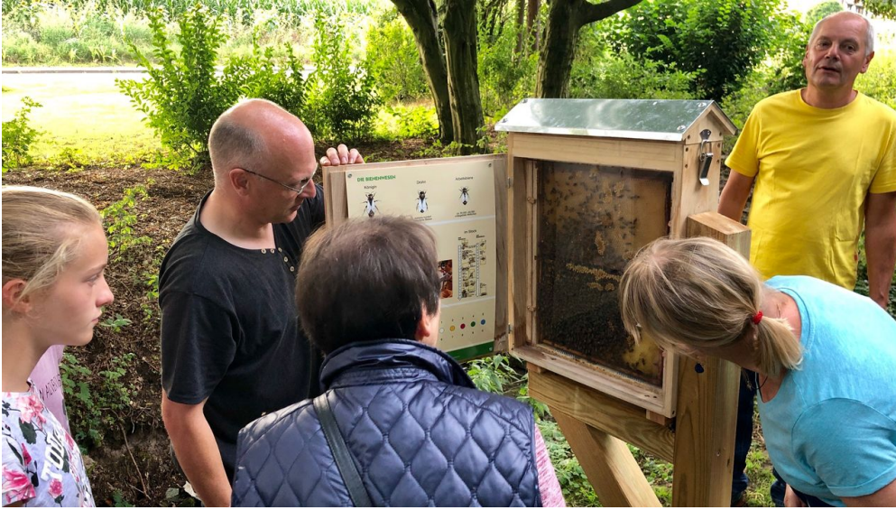
Gruppe am Bienenschaukasten