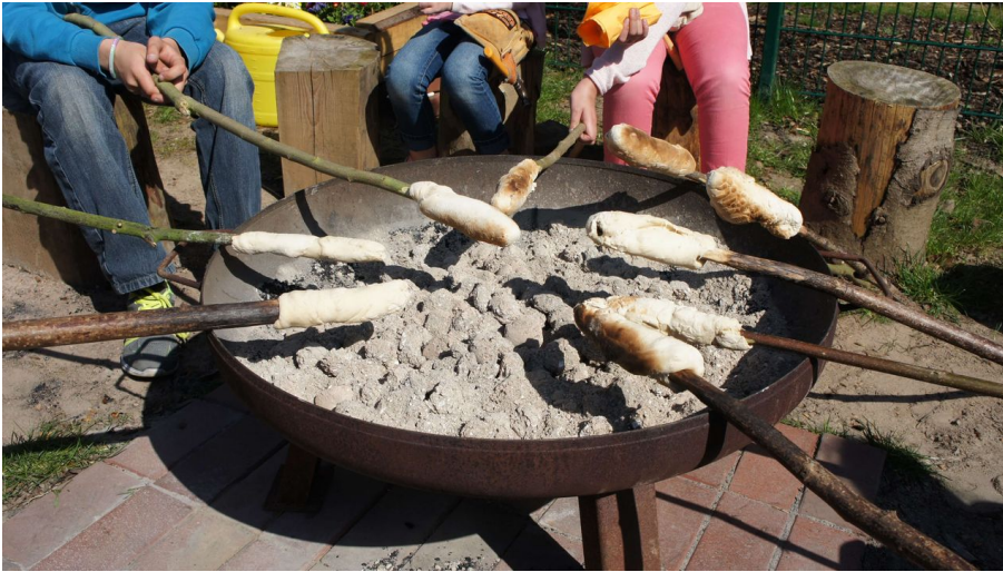
Stockbrot auf dem Abenteuerspielplatz Monheim