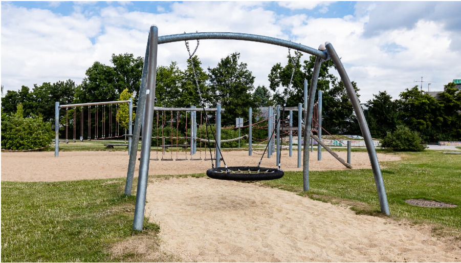
Spielplatz Am Sandbach in Ratingen