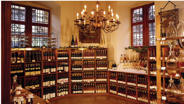
Iselin Wein Verkauf