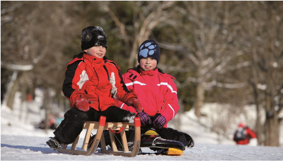
Rodelspass_U. Klumpp - © U. Klumpp