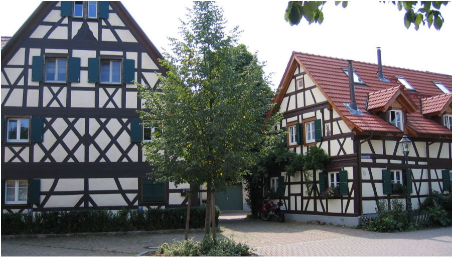
Hänferdorf - © Tourist-Info Bühl