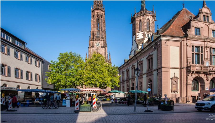
Böhler Wochenmarkt