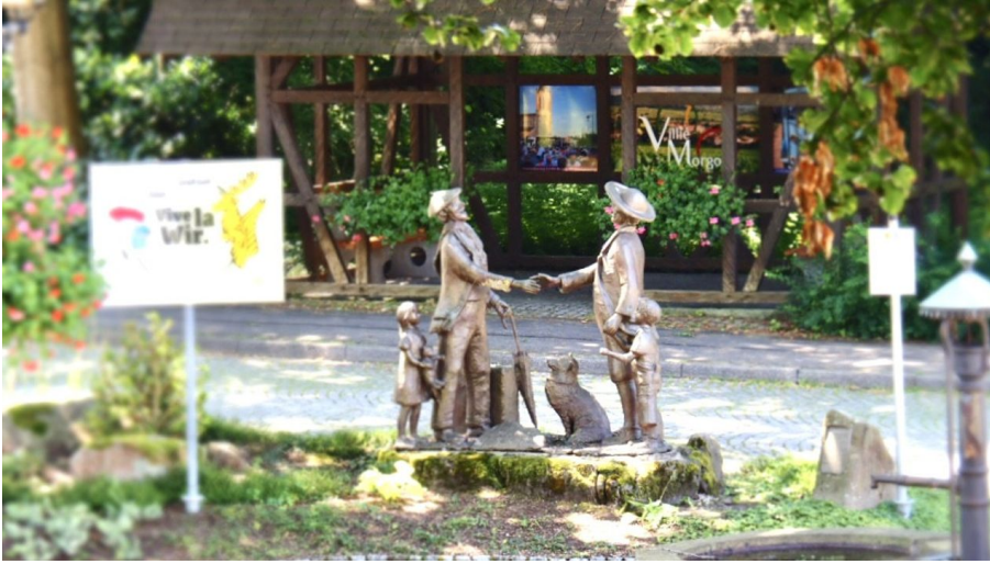
Villié-Morgon Platz