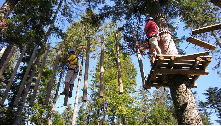
Klettergarten am Mehlskopf