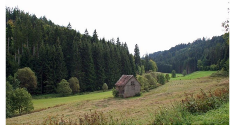
Im Zinsbachtal bei Pfalzgrafenweiler