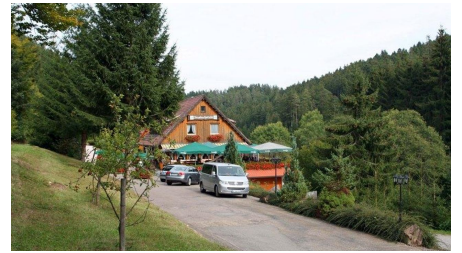
Die Zinsbachstube bei Wörnersberg