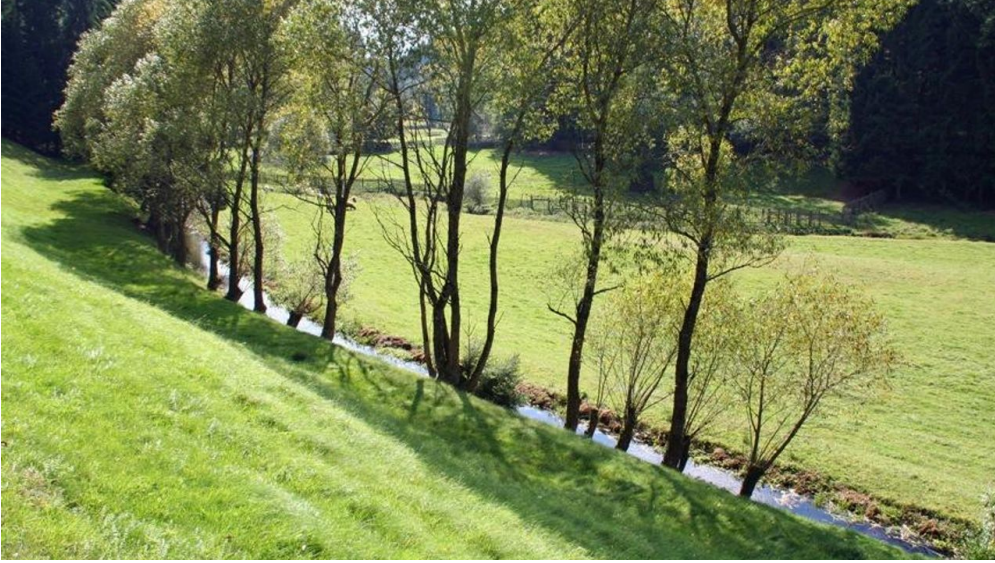
Im Zinsbachtal bei Pfalzgrafenweiler - © Jens Teufel, Nationalparkregion Schwarzwald - Freudenstadt