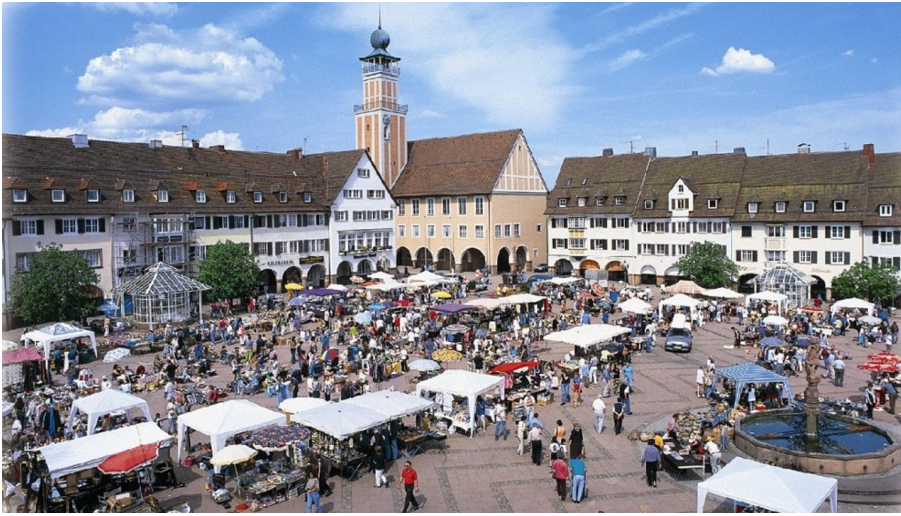
Freudenstadt Tourismus, Nationalparkregion Schwarzwald - Freudenstadt