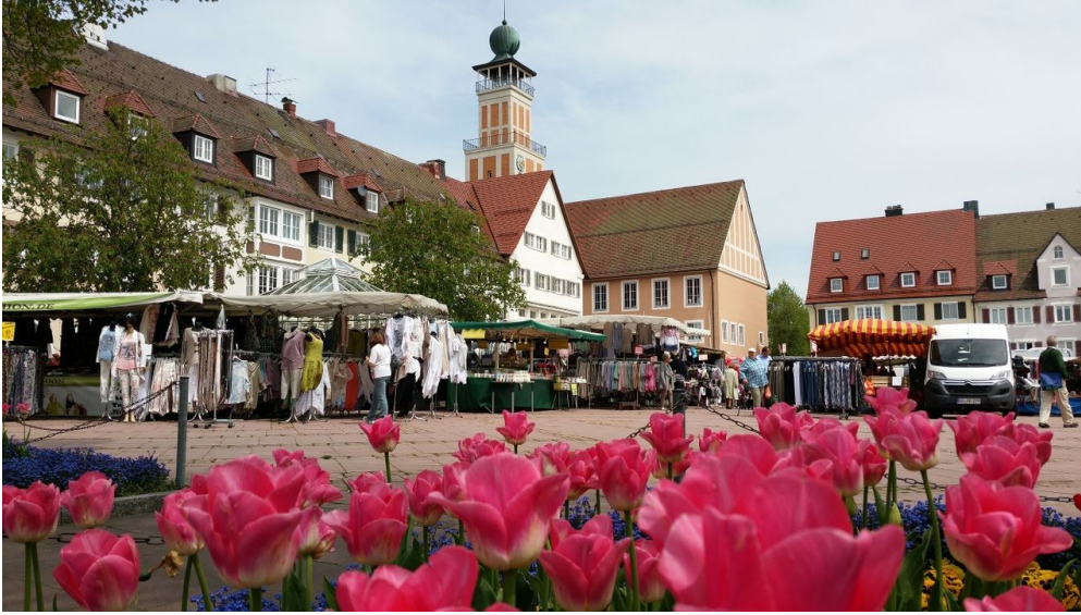
Der Maimarkt in Freudenstadt