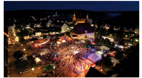
Blick vom Rathausurm auf das Stadtfest