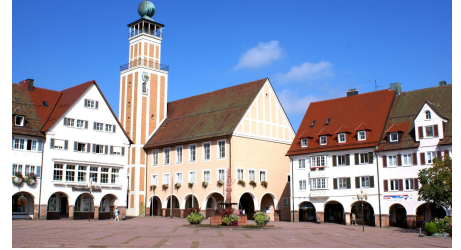
Freudenstadt Tourismus, Nationalparkregion Schwarzwald - Freudenstadt