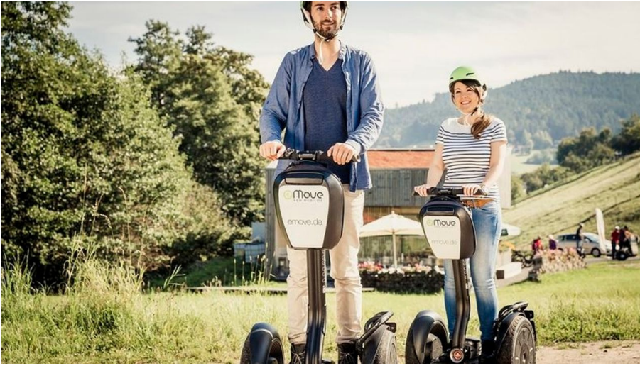
Segway fahren ist mit der Schwarzwald Plus Karte kostenlos.