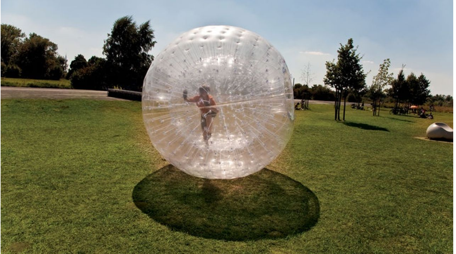
Rund geht es beim Zorbing.

Öffnungszeiten immer nach Vereinbarung zu gebuchten Events