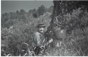
Kirschernte in den 1940er Jahren