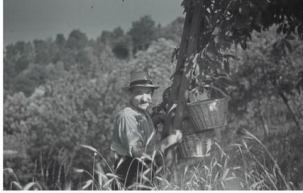
Kirschernte in den 1940er Jahren