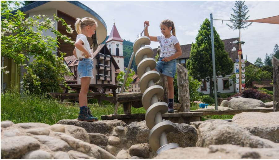
Erlebnisbereich Wasser