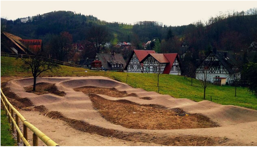
Sasbachwalden im Schwarzwald