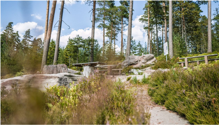
Sitzgelegenheiten rund um den Priorstein

In diesem verwitterten Felsen aus Bundsandstein entstand im Laufe der Zeit eine kugelförmige Höhlung, die einem Sessel gleicht.