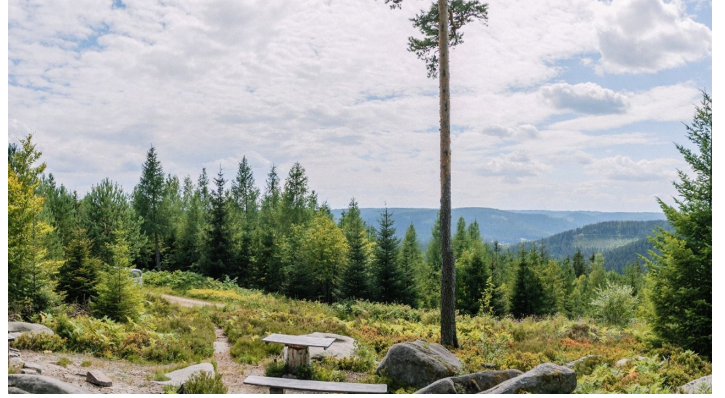
Aussicht am Priorstein - © Baiersbronn Touristik/ Max Günter, Nationalparkregion Schwarzwald - Baiersbronn / Murgtal