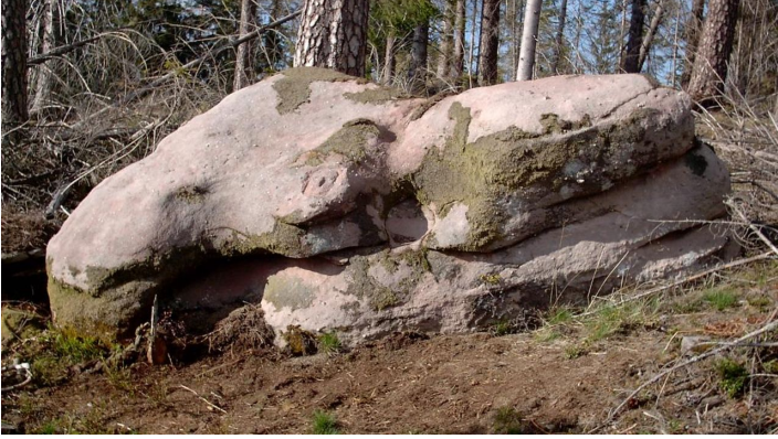
Priorstein in Tonbach