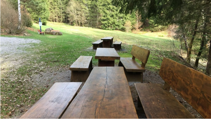
Sitzplätze laden zur Rast ein.