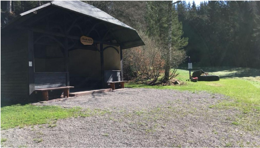
Die Ellbachhütte in Mittelatal lädt zu einem Abstecher ein.