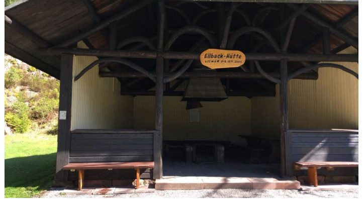
In der Eilbachhütte in Mitteltal kann gegrillt werden.