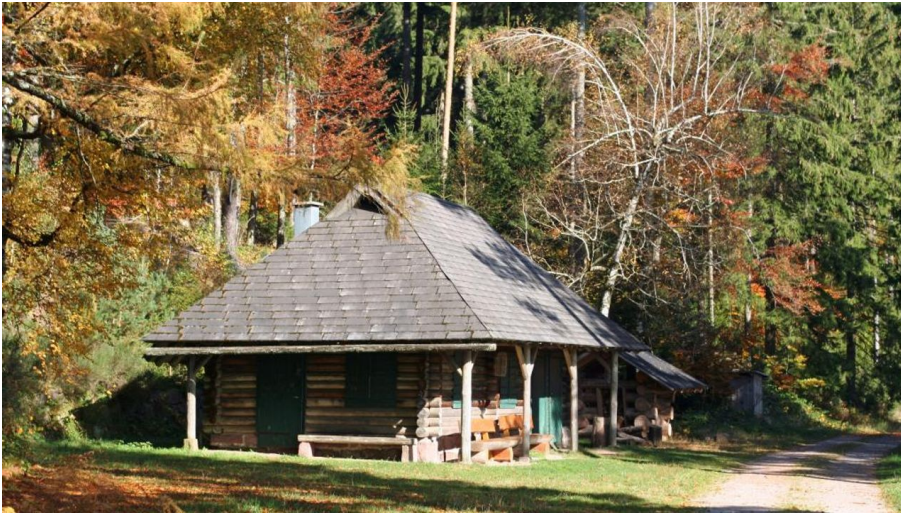
Die Hahnenhütte im Herbst