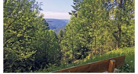
Bank mit Aussicht an der Hahnenhütte