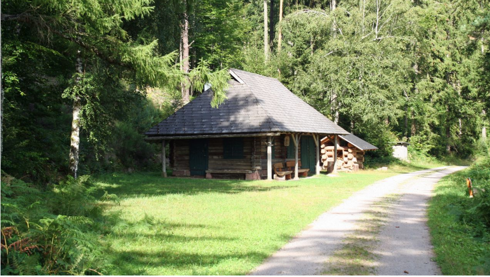
Die Schutzhütte "Hahnenhütte"