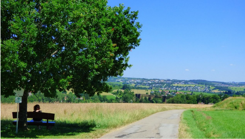
Karl-Maier-Bank mit Radweg und Blick Richtung Wittlensweiler und Hallwangen