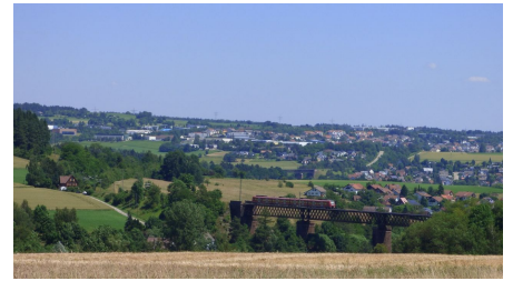
Eisenbahn-Viadukt Wittlensweiler und im Hintergrund Hallwangen