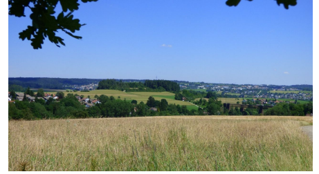
Blick von der Karl-Maier-Bank zum Forchenkopf