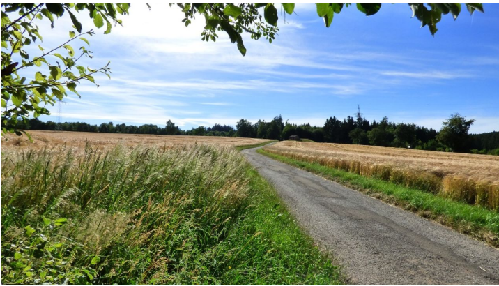
Blick von der Karl-Maier-Bank Richtung Norden