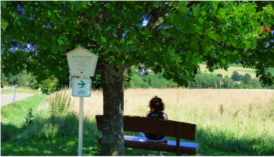
Die Karl-Maier-Bank

Sitzbank am Ostweg und Schwarzwaldhöhenradweg Ost zwischen Freudenstadt und Wittlensweiler mit herrlichem Blick zum Eisenbahn-Viadukt Wittlensweiler und nach Dornstetten-Hallwangen.