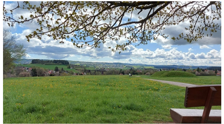
Blick zum Forchenkopf