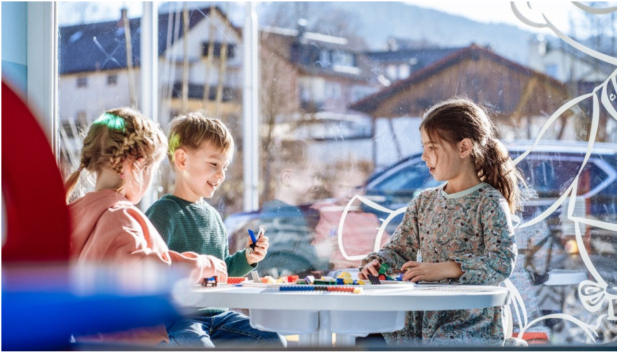
Kinder spielen in Murgels Spielhaus