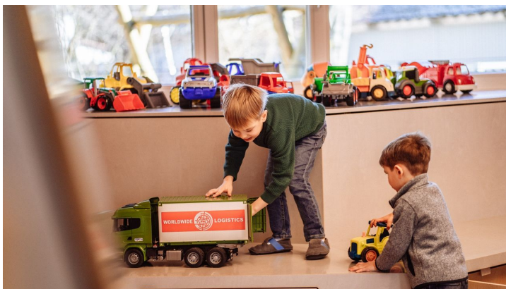
Kinder spielen in Murgels Spielhaus