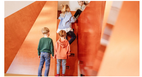
Kinder steigen auf die Rutsche in Murgels Spielhaus