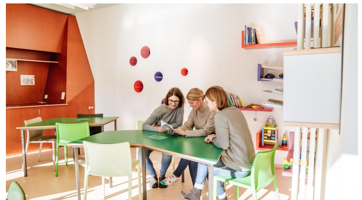
Eltern sitzen im Elternraum in Murgels Spielhaus