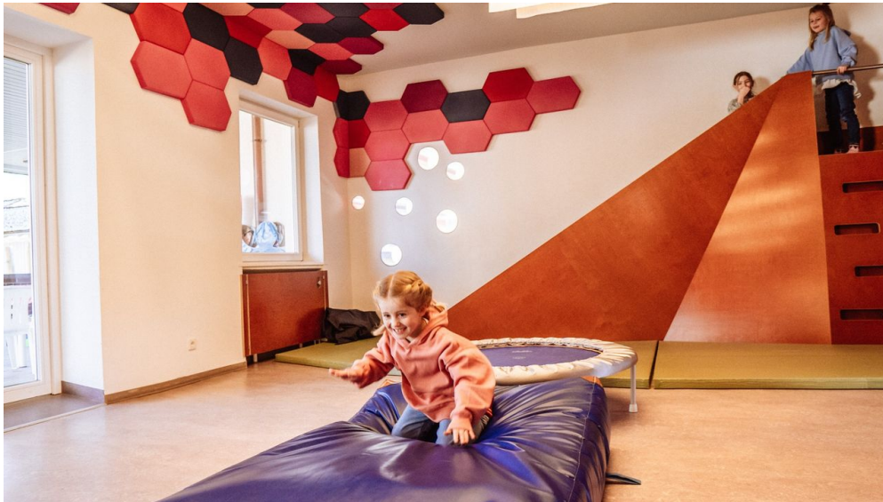
Trampolinspringen in Murgels Spielhaus

Vom 17.04.-23.04.2023 hat Murgel Spielhaus aus betrieblichen Gründen geschlossen.