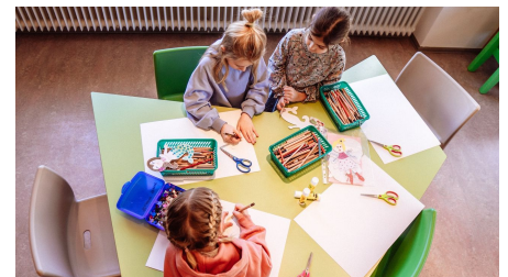
Kinder basteln in Murgels Spielhaus