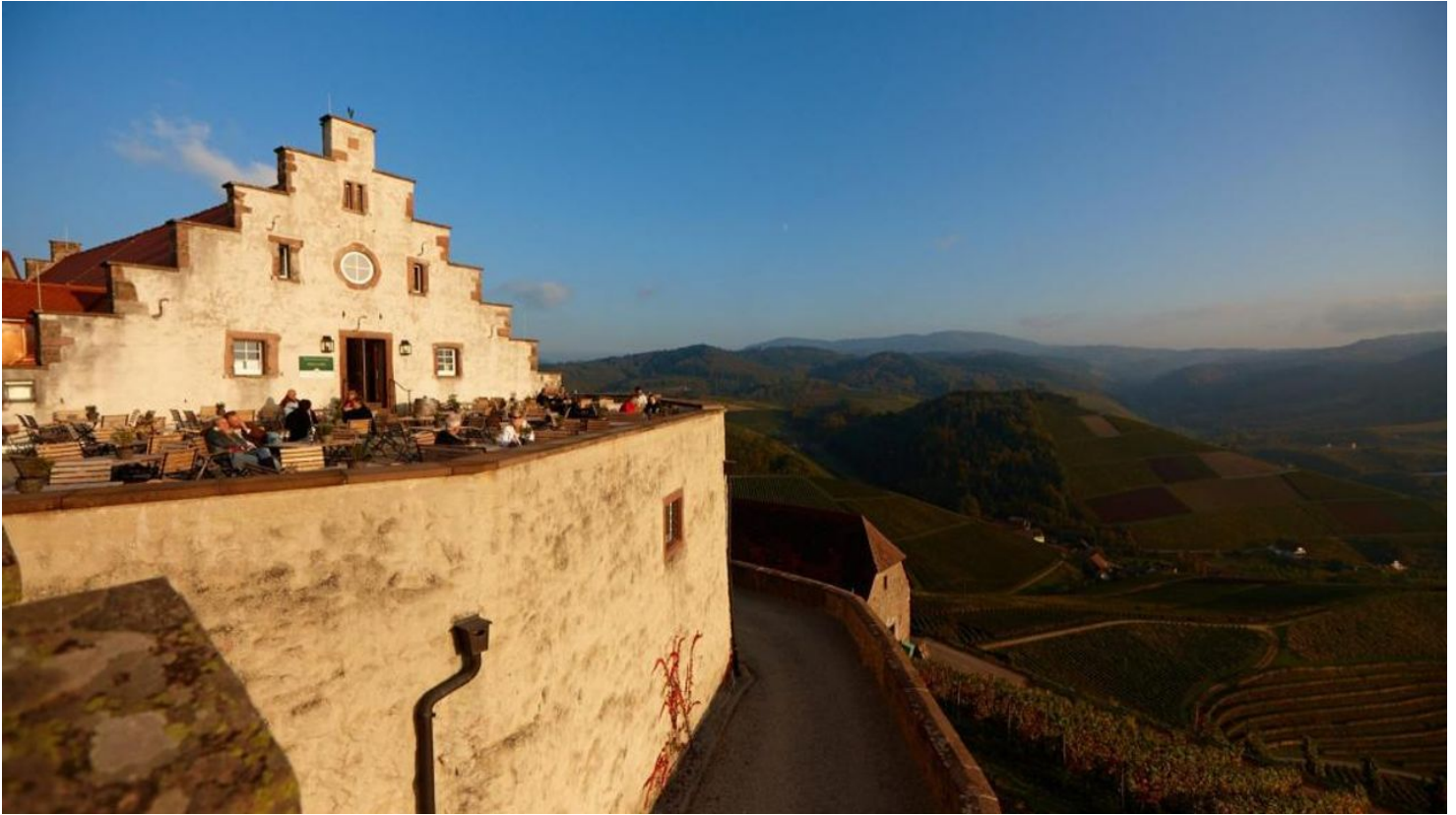
Die Terrasse auf Schloss Staufenberg

Uhr geöffnet. Montag und Dienstag geschlossen. Ab 15 Personen und einem Mindestumsatz von 500 Euro sind wir auch nach 18 Uhr für Sie da! Weinverkauf Weingut Markgraf von Baden: April bis Oktober: Montag - Freitag: 10.00 bis 19.00 Uhr Samstag, Sonn- und Feiertage: 11.00 bis 17.00 Uhr November bis März: Montag - Freitag: 10.00 bis 17.00 Uhr Samstag: 11.00 bis 15.00 Uhr Sonn- und Feiertage: geschlossen