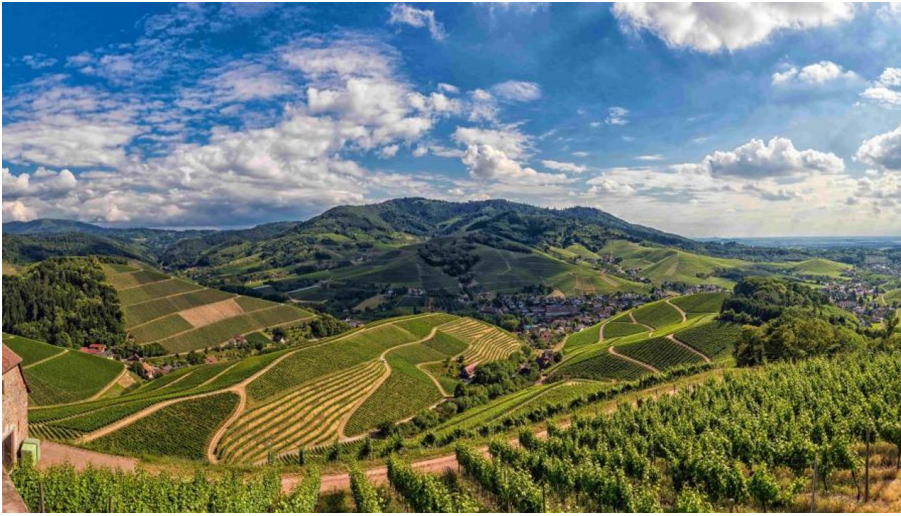
Ausblick von der Schlossterrasse ins Durbachtal