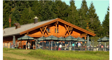
Kniebis-Hütte im Sommer