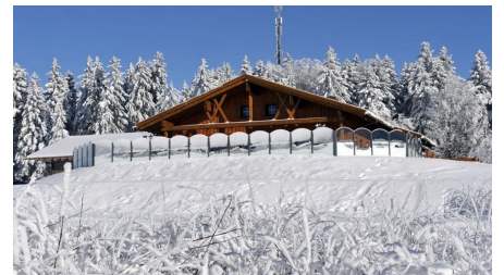
Kniebis-Hütte im Winter