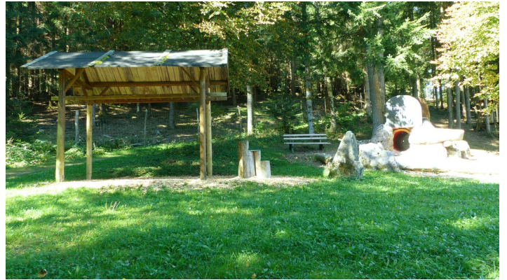
Klettergerüst und Tunnel beim Spielplatz Ellbachtal Mittelatal