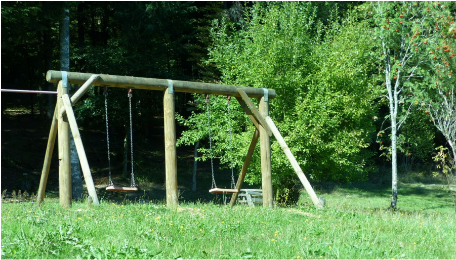
Die Schaukel beim Spielplatz Ellbachtal Mittelal