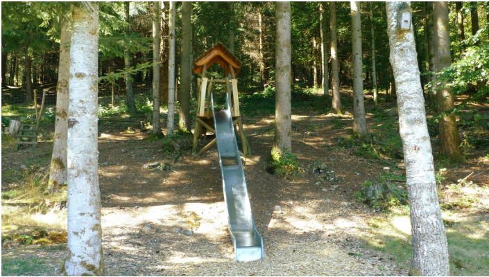
Die Rutsche beim Spielplatz Ellbachtal Mittelatal