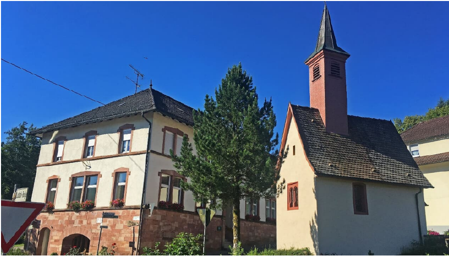
St. Jakobus-Kaplle