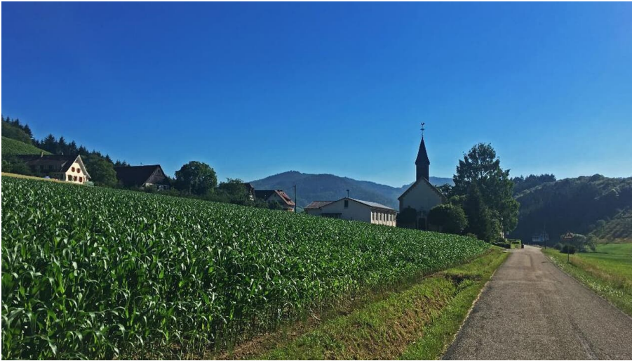
Kapelle Hesselbach