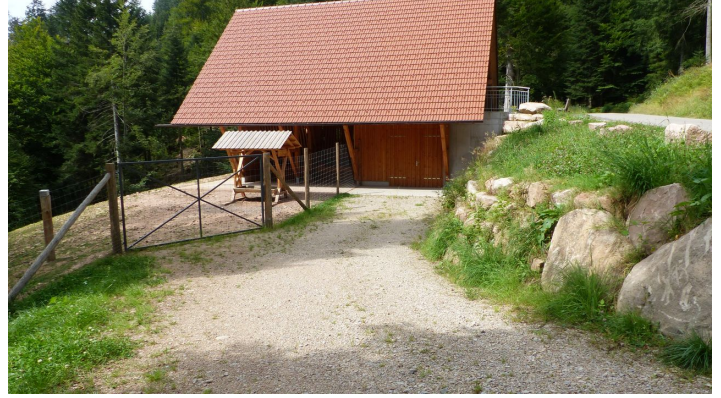
Futterhütte im Wildgehege Tonbach