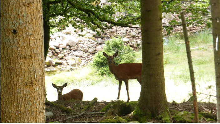
Rotwild im Gehege Tonbach