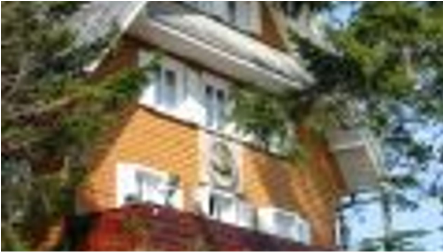
badener höhe - © Tourismus Zweckverband "Im Tal der Murg", Nationalparkregion Schwarzwald - Baiersbronn / Murgtal