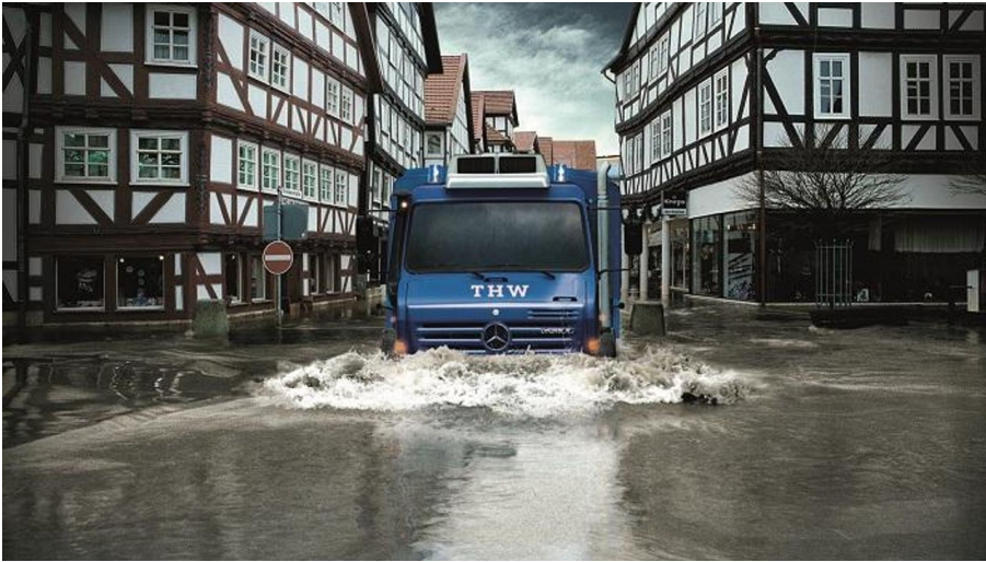
Sonderausstellung 2012