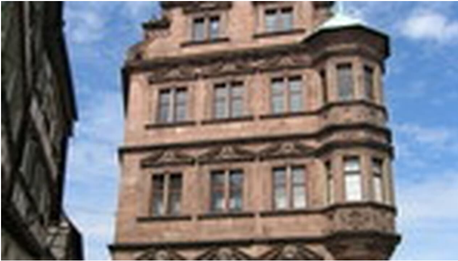
Touristinfo Gernsbach, Touristinfo Gernsbach