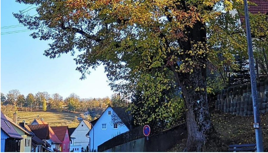
Weg der Besinnung, Station 9, Alte Linde Haiterbach