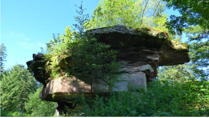
Der Kastelstein von Süden