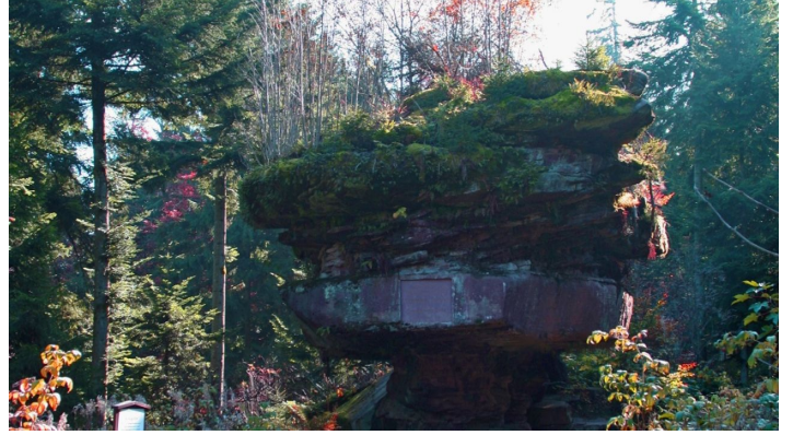
Der Kastelstein im Herbst - © Jens Teufel, Nationalparkregion Schwarzwald - Freudenstadt