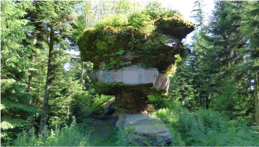
Naturdenkmal Kastelstein