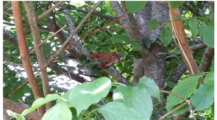
Mit etwas Glück zu entdecken: ein Eichhörnchen auf dem Kienberg