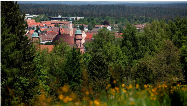
Blick vom Kienberg auf Freudenstadt mit Stadtkirche und Rathaus