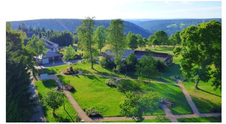
Der Freudenstädter Kienberg