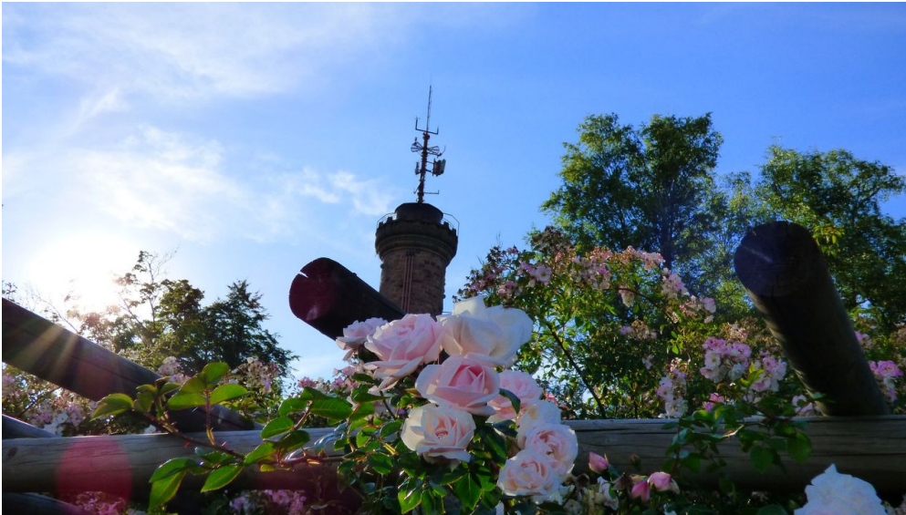
Pergola am Rosenweg mit Friedrichsturm