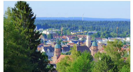
Blick auf Freudenstadt (Steinwaldstraße - Zoom)