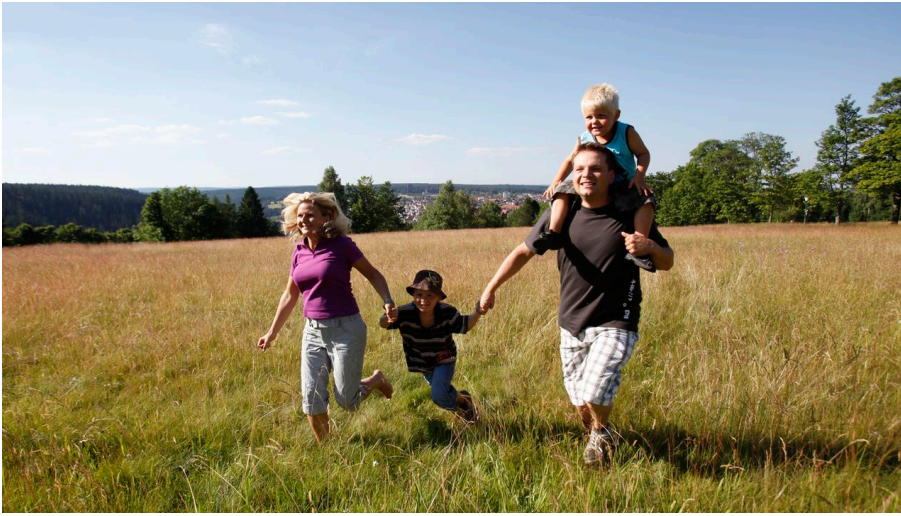
Familie auf dem Kienberg