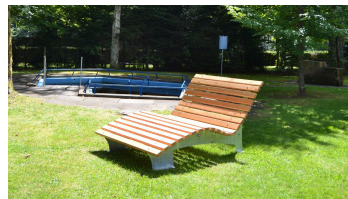
neue Wellnessbänke bei der Wassertretanlage auf der Kienberg-Liegewiese - © Freudenstadt Tourismus, Nationalparkregion Schwarzwald - Freudenstadt