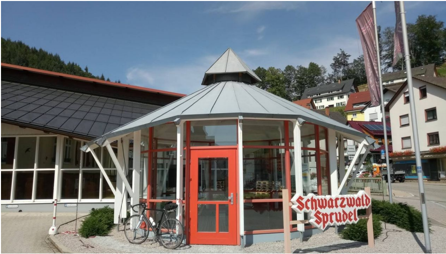
Mineralwasser Brunnen der Firma Schwarzwald Sprudel