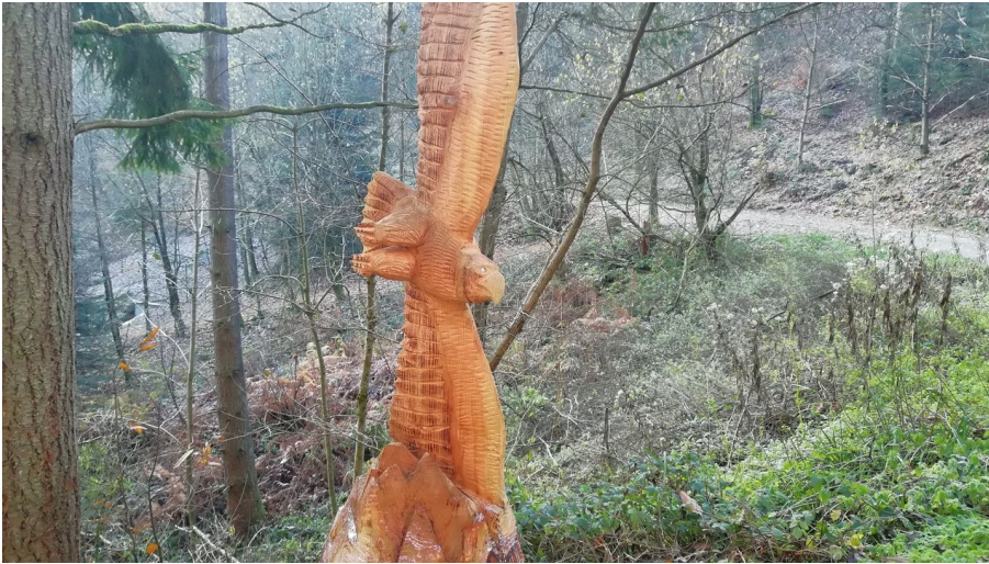
Adler im Flug