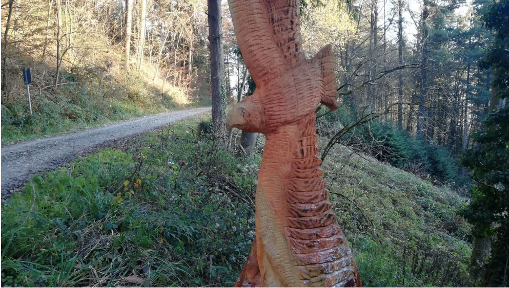
Adler im Flug