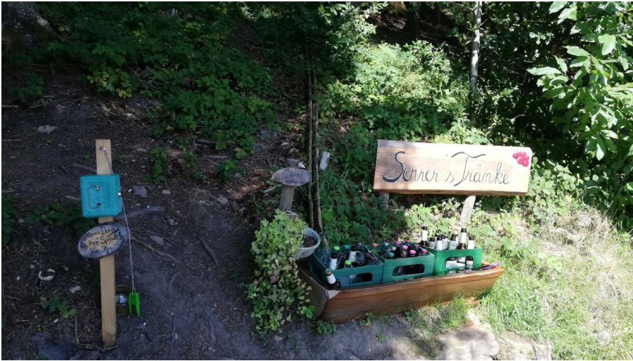
Oliver Porcher, Premiumwanderort Bad Peterstal-Griesbach/Nationalparkregion Schwarzwald