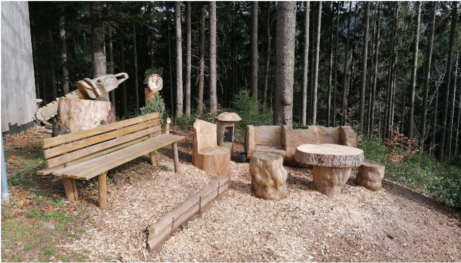
Bierbrunnen am Stieg

Schattiger Bierbrunnen am Premiumwanderweg Wiesensteig mit liebevoll gestalteter Sitzgelegenheit. Der Bierbrunnen wird vom Forstbetrieb Kessler betrieben.