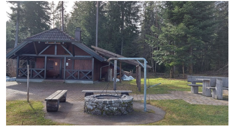
Grillplatz Rappenhütte Igelsberg - © Isabel Blüher-Hanas, Nationalparkregion Schwarzwald - Freudenstadt