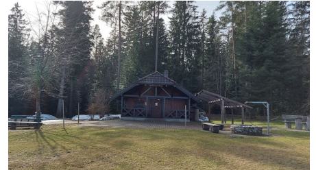
Grillplatz Rappenhütte Igelsberg