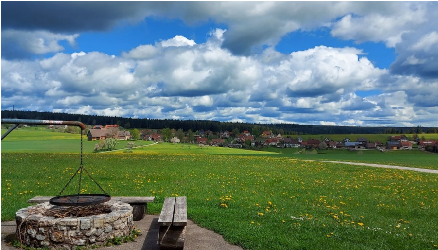
Grillstelle Rappenhütte bei Igelsberg