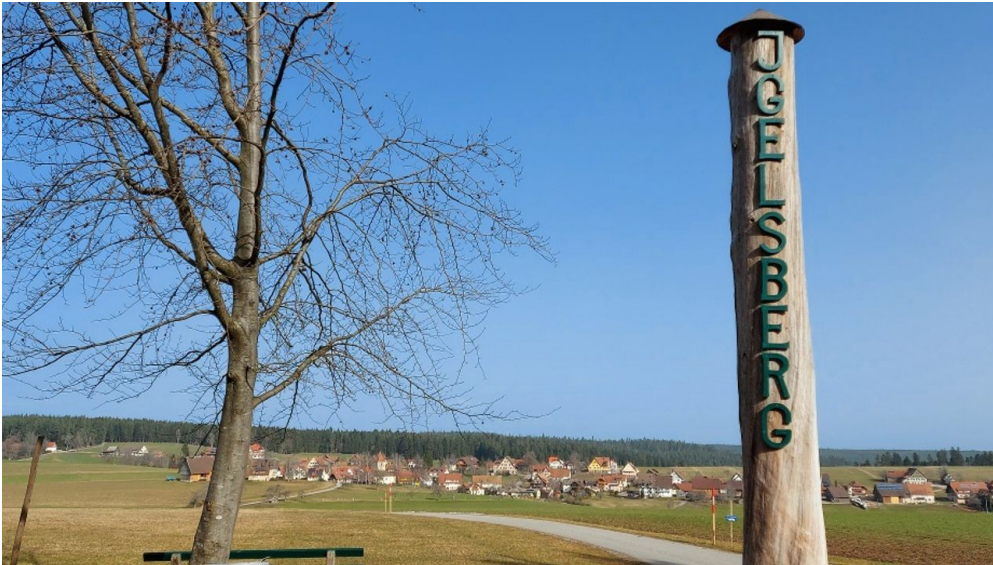
Blick auf Igelsberg bei der Rappenhütte - © Isabel Blüher-Hanas, Nationalparkregion Schwarzwald - Freudenstadt