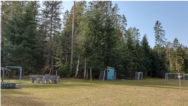
Fußballplatz bei der Rappenhütte Igelsberg