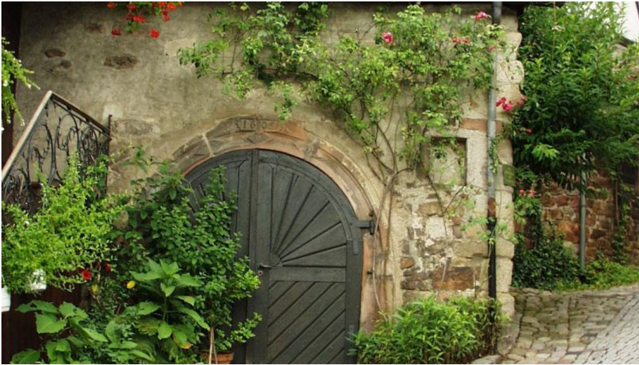
Touristinfo Gernsbach, Touristinfo Gernsbach