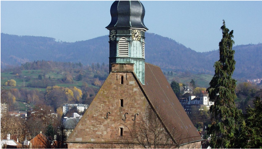
Touristinfo Gernsbach, Touristinfo Gernsbach