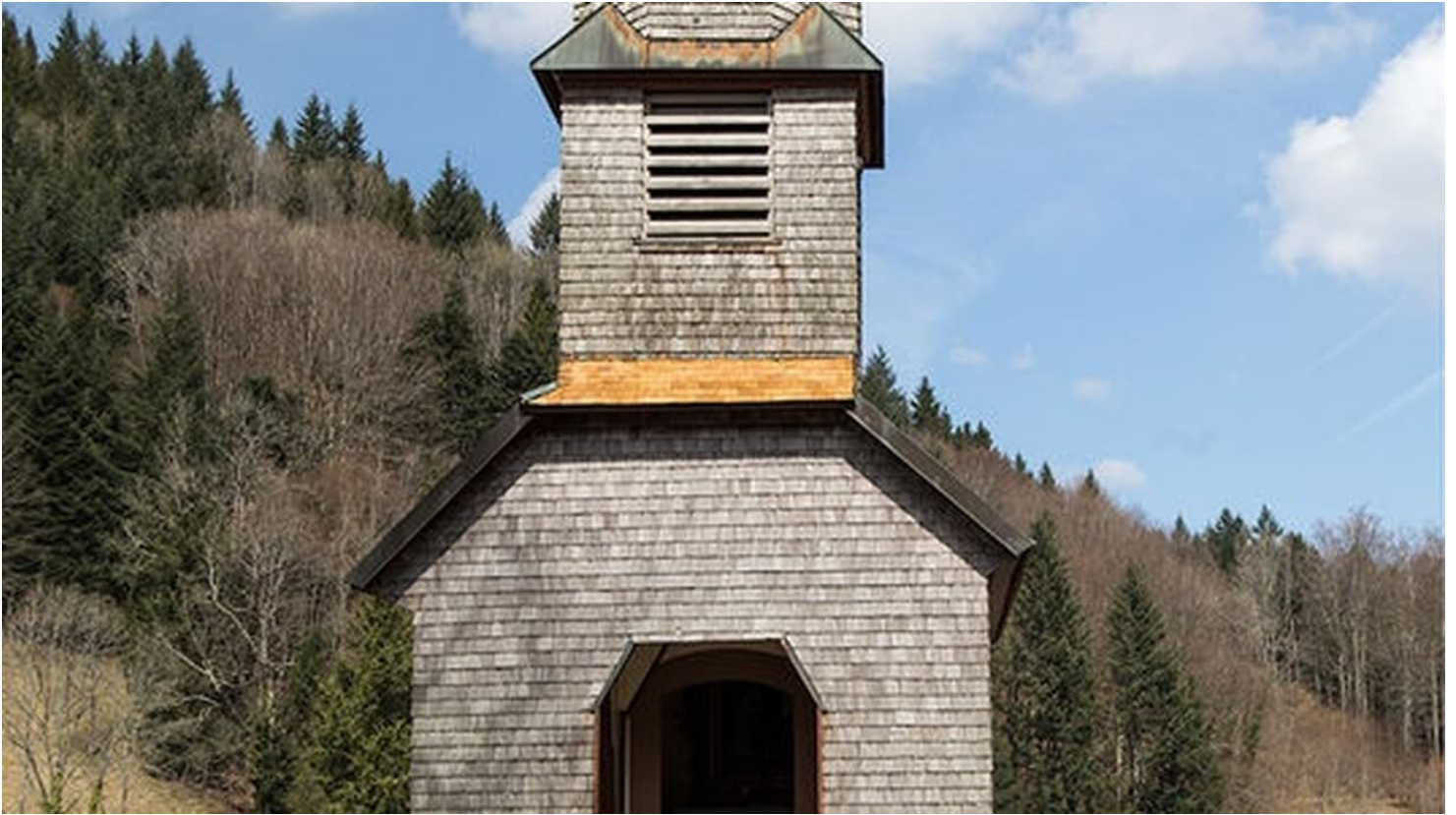
Premiumwanderort Bad Peterstal-Griesbach/Nationalparkregion Schwarzwald