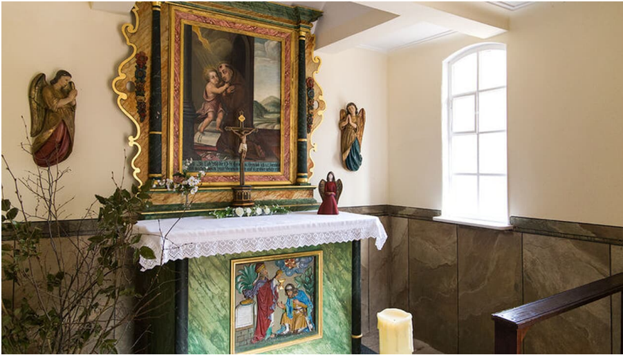
Premiumwanderort Bad Peterstal-Griesbach/Nationalparkregion Schwarzwald

Die kleine Antoniuskapelle auf dem Kapellenberg wurde komplett restauriert und ist ein schönes Ausflugsziel für einen Spaziergang rings um Bad Griesbach.