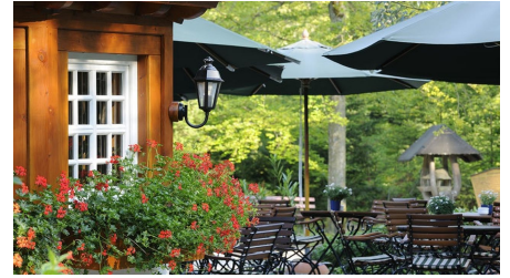
Terrasse der Wanderhütte Sattellei