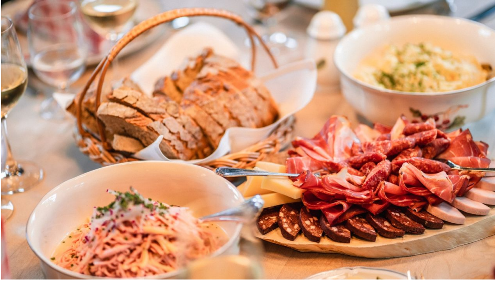
Wanderhütte Sattellei