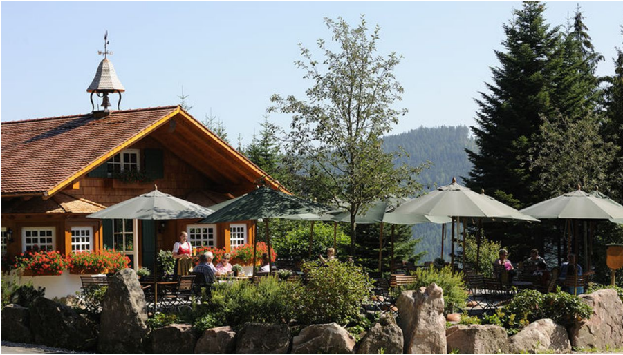
Die Sattelleihütte mit Terrasse