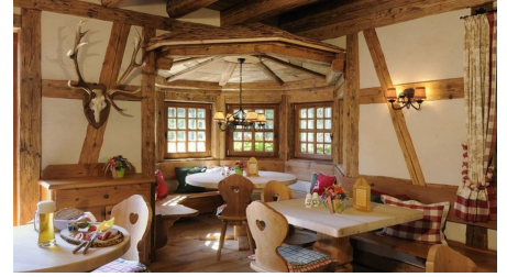
Innenansicht der Wanderhütte Sattellei