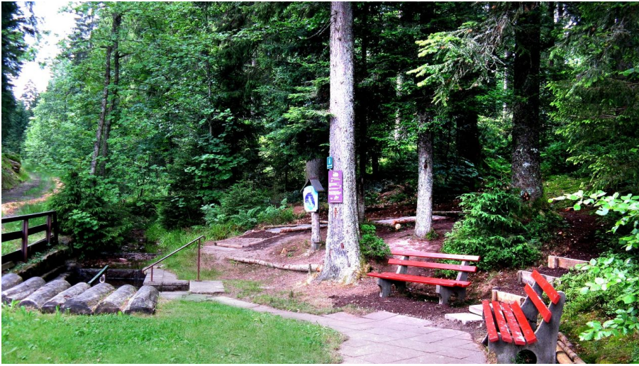
Barfussweg am Ende des Feuerwehrwege Kniebis