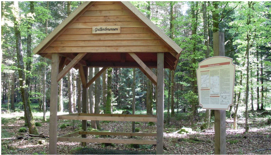
Der Gallenbrunnen auf dem Hirschkopf

Der Gallenbrunnen liegt versteckt mitten im Wald bei der einstigen Glashütte auf dem Hirschkopf. Der historische Glasbrunnen wurde 2011 instand gesetzt. Eine Infotafel gibt Hinweise zu den früheren Waldglashütten und Mönchswegen in der Region Freudenstadt.