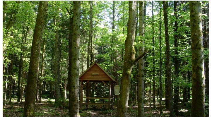
Der Gallenbrunnen, mitten im Wald