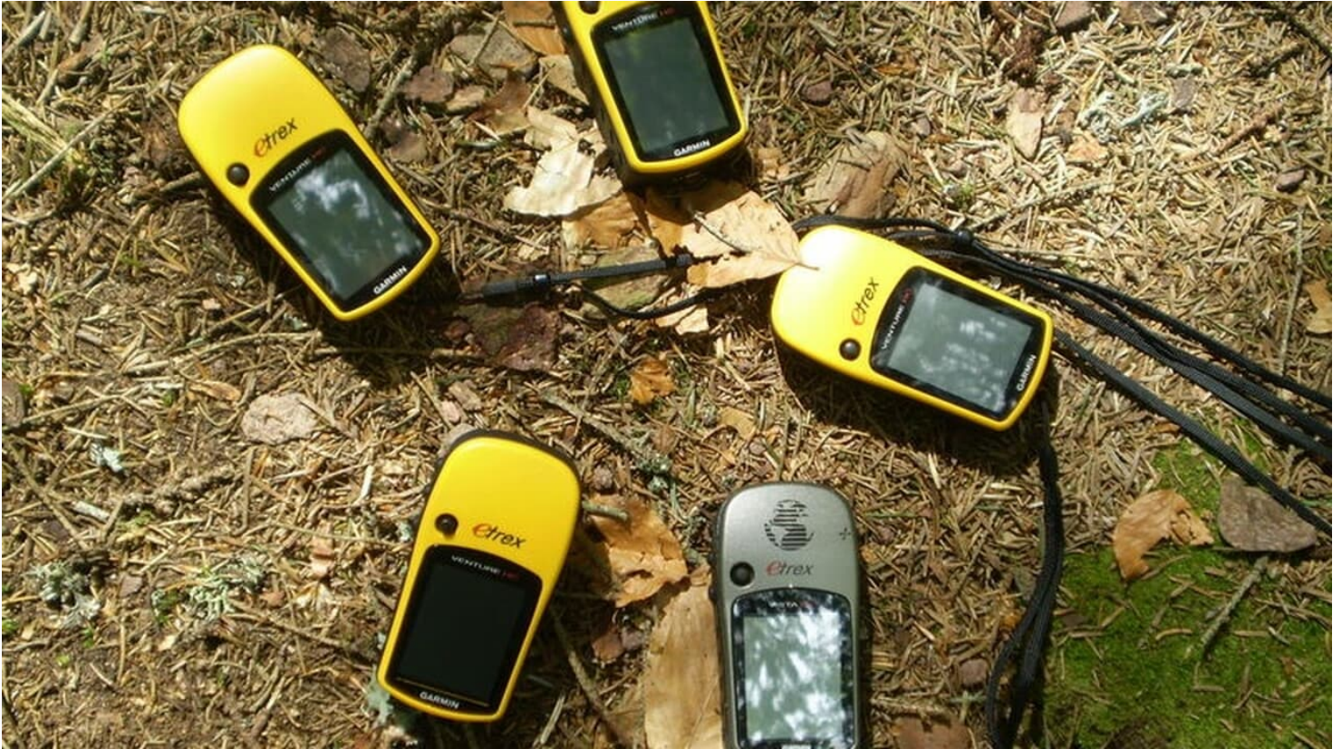
GPS Geräte