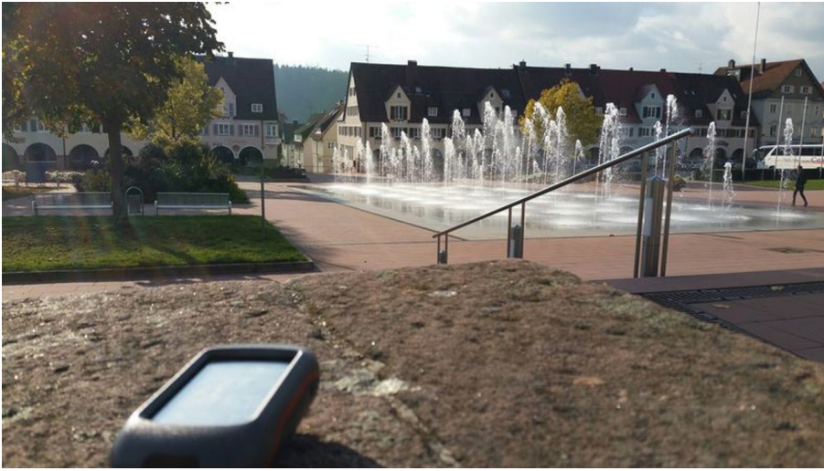
Unterer Marktplatz