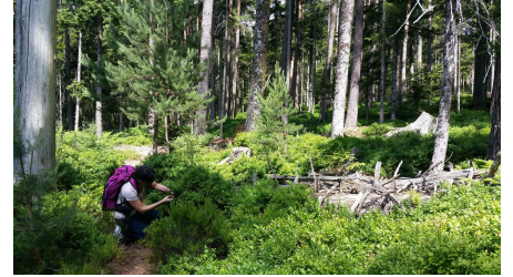
Heidelbeeren im Baldenhofer Graben