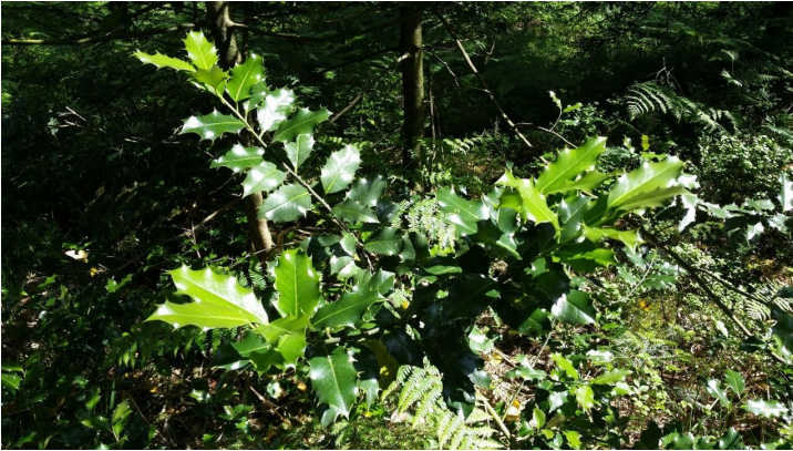
Woher kommt der Name "Palmenwald"? - © Isabel Blüher-Hanas, Nationalparkregion Schwarzwald - Freudenstadt