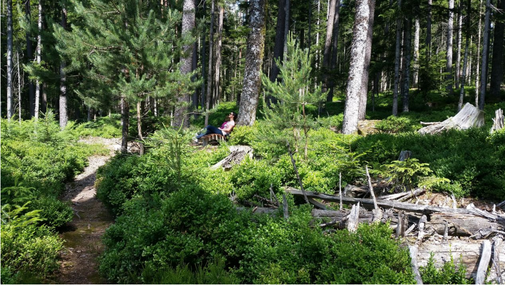
Entspannen auf der Wohlfühlbank im Baldenhofer Graben