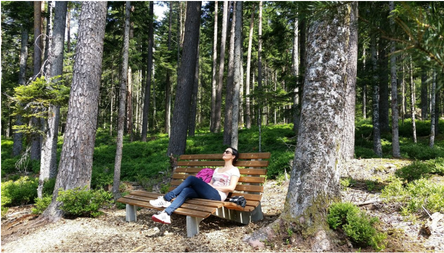
Naturgenuss auf der Wohlfühlbank