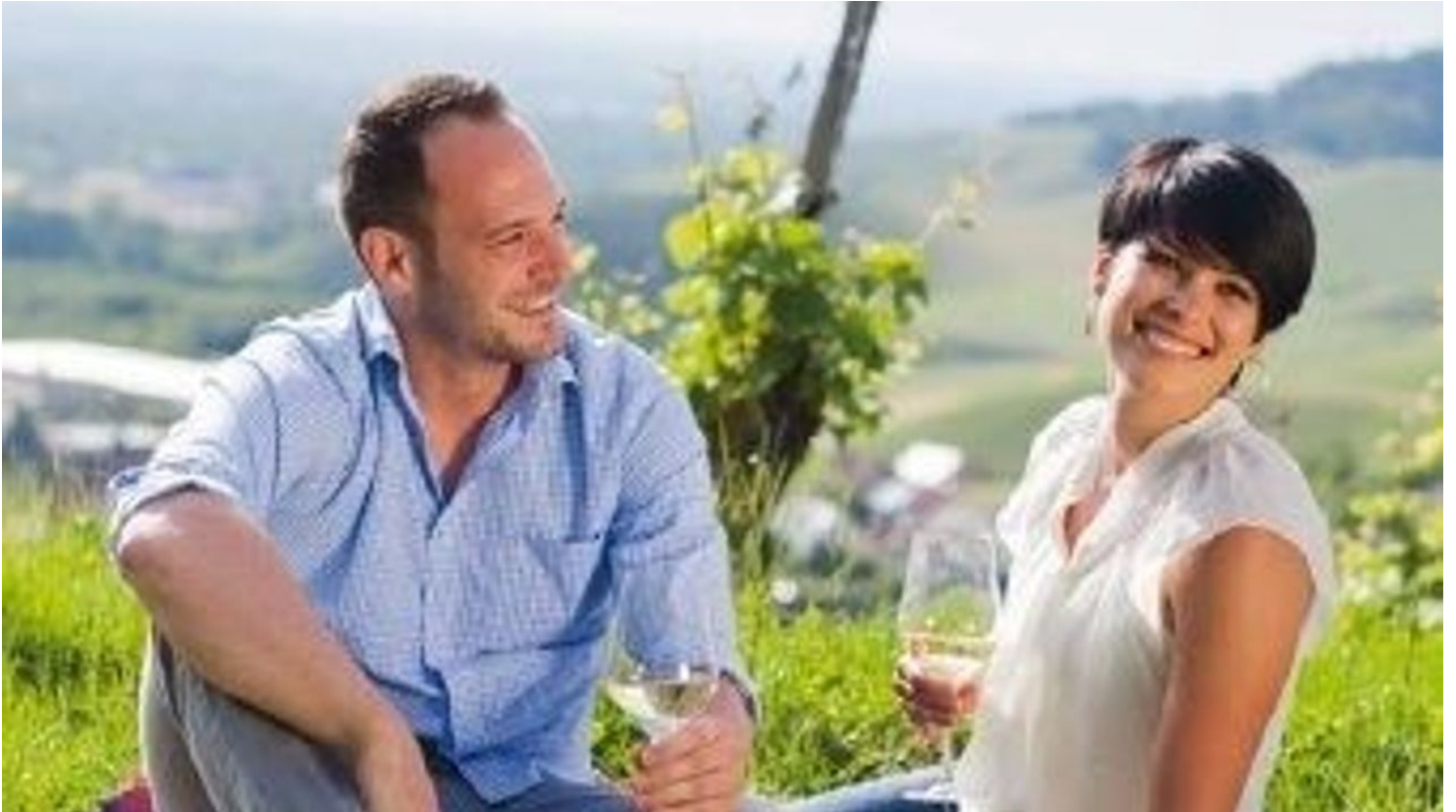
Weinparadies Ortenau e.V., Unbekannt

Quelle: destination.one ID: p_100152455 Zuletzt geändert am 08.03.2024, 04:27