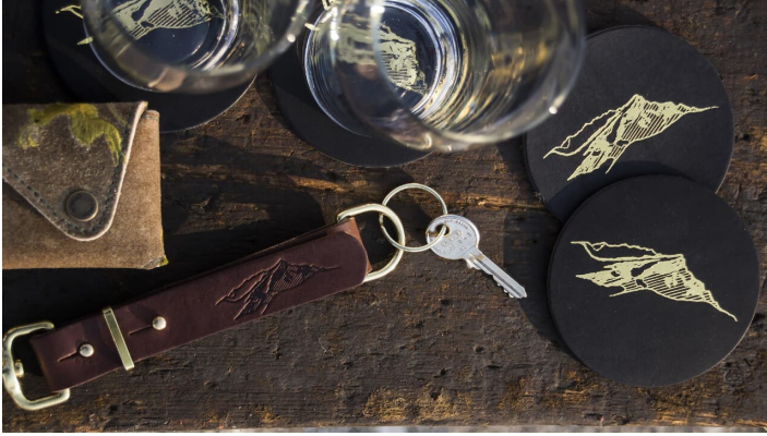
Verschiedenes - © Florian Wöretshofer/Verena Mandl