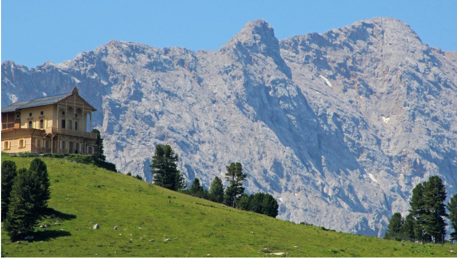
Königshaus am Schachen