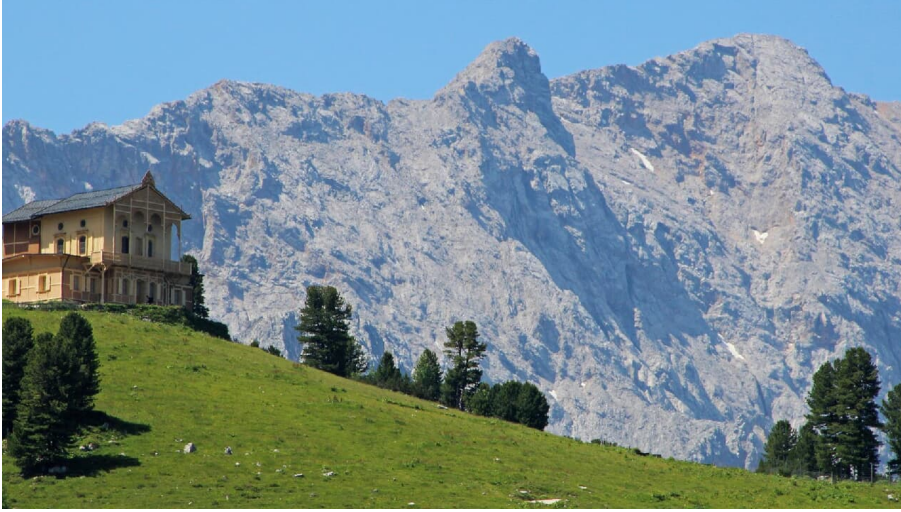
Königshaus am Schachen